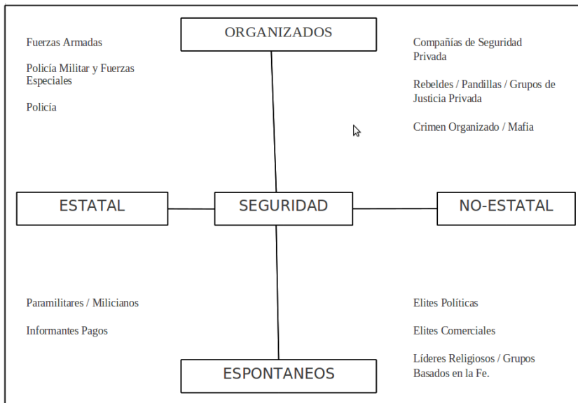
Una tipología de grupos armados y actores relacionados.

Una tipología alterna considera las siguientes formas de violencia post conflicto (con indicadores de violencia entre paréntesis): violencia política (asesinatos, ataques con bomba, secuestro, tortura, genocidio, desplazamiento masivo, disturbios); violencia estatal rutinaria (actividades violentas de refuerzo de la ley, asesinatos en reuniones, operaciones de limpieza social, tortura rutinaria); violencia económica y relacionada con el crimen (robo a mano armada, extorsiones, secuestros económicos, control de los mercados a través de la violencia);